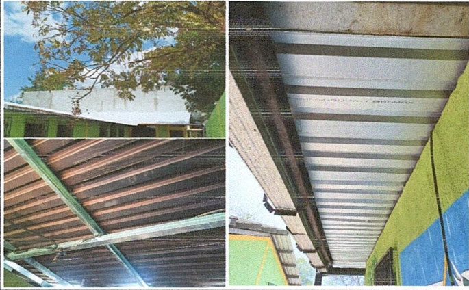
Foto 1: Mejoramiento de techo en modulo de salones de clases, bodega y cocina.