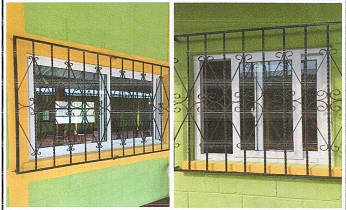
Foto 2: Mejoramiento de ventanas para una mejor ventilación e iluminación.